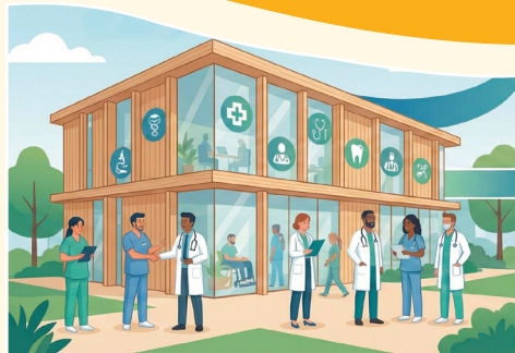
Construire une maison médicale pluriprofessionnelle

MOYENNE NATIONALE : 1 MÉDECIN pour 685 HABITANTS (INSEE)