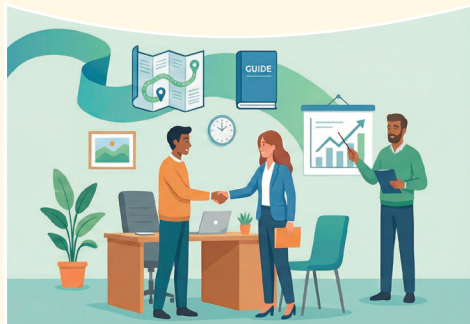
Créer une cellule d'accompagnement à l'installation